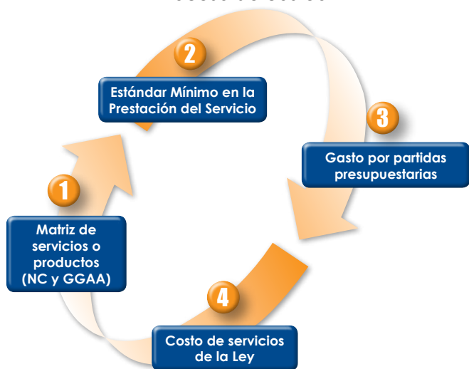
Gráfico 2 Proceso de costeo

d) Costos de servicios de la Ley: El final del proceso implica asignar un monto total del servicio de acuerdo a los estándares mínimos.