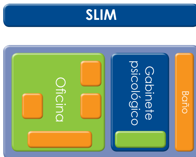
Gráfico 4 Infraestructura SLIM

Cabe recalcar nuevamente que tanto los metros cuadrados (m 2 ) como el costo unitario es referencial, por tanto un cambio de estos datos contextualizado a la realidad del GAM, permite obtener datos más precisos para la entidad ejecutora, por ejemplo si el costo por metro cuadrado en un municipio es de Bs1.500 el monto de inversión será de Bs50.000 (ver Tabla 5.1).